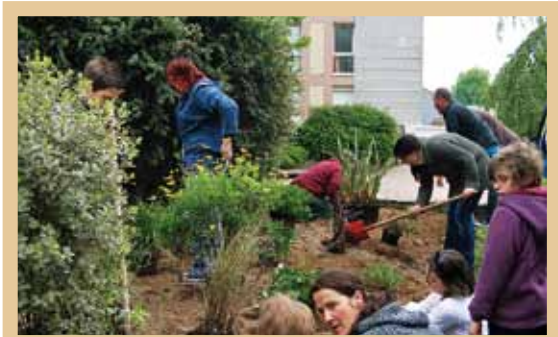
Aménagement de l'aire de jeux du quartier Claires-Fontaines réalisé en mai 2011 en partenariat avec les espaces verts de la Ville de Coutances

Une relation régulière est établie avec la municipalité