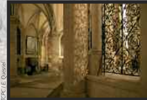
TCPC / E. Quesnel