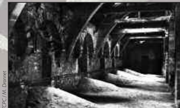
TCPC / M. Dronnet