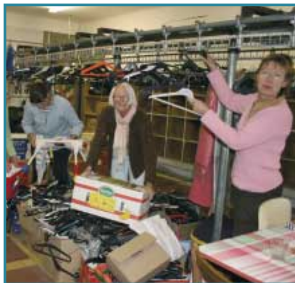
Le Secours Populaire déménage