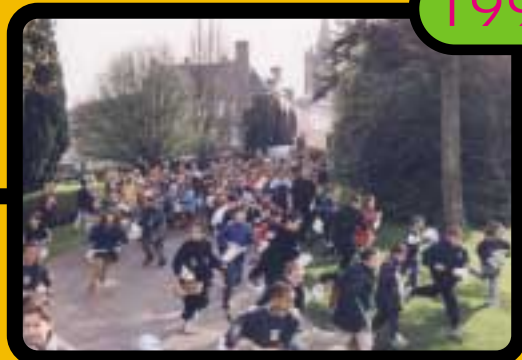
Que ne ferait-on pour du chocolat ? Course aux œufs de Pâques pour quelques 500 enfants dans le jardin public.

Ce fut un enrichissement personnel, les plus belles années de ma jeunesse. (Isabelle)