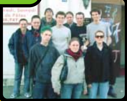
L'équipe d'organisation en compagnie du groupe "Spoonful" vainqueur du Tremplin Musical.