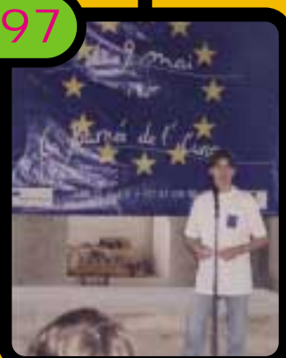
Le conseil des jeunes fête l'Europe à travers de nombreuses animations et une grande exposition à l'église Saint-Nicolas