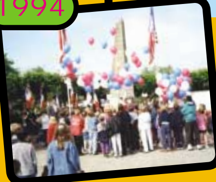
Commémoration du 60 ème anniversaire du bombardement de Coutances le 6 juin 1994 et lâcher de ballons "républicain" par le CDJ.