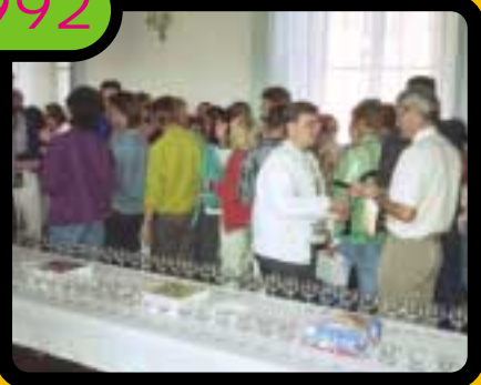
Accueil d'une délégation des jeunes d'Ochsenfurt dans les salons de la mairie avec les personnalités locales.

Je suis persuadée que mon expérience au conseil des jeunes m'a donné confiance en moi et m'a montré ce qu'était un projet et les moyens de le réaliser. Pour moi, le conseil des jeunes est proche de cette démarche d'écoute, de prise en considération, de responsabilité, de socialisation, d'implication personnelle et de projet que j'essaie de transmettre dans mon métier. (Elodie)