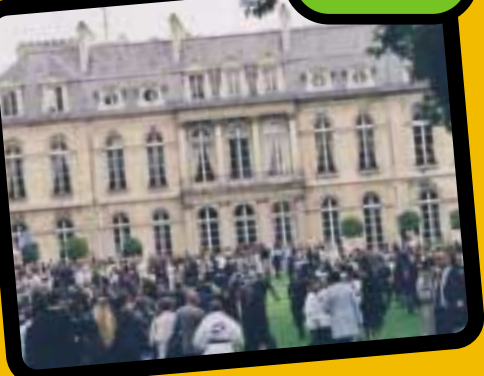
Dans les Jardins du Palais de l'Élysée, à l'invitation du Président Chirac, à l'occasion de la "Garden-Party" du 14 juillet.

Ce fut pour moi une approche différente dans la vie de tous les jours, plus d'écoute, une maturité peut-être plus importante et surtout une aide à la communication et un tournant vers le monde extérieur.