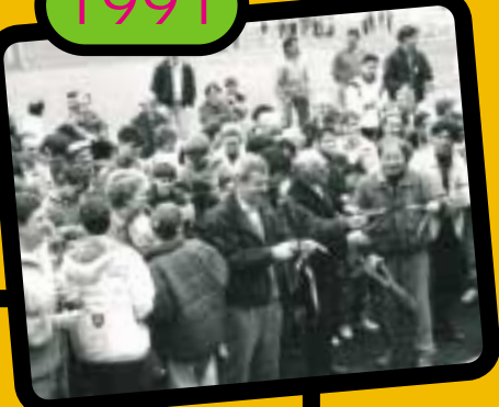
Réalisée à l'initiative du CDJ, inauguration de la rampe de skate lors de la journée du sport.