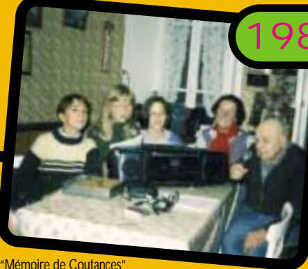
"Mémoire de Coutances" À la rencontre des anciens de Coutances. Enregistrement de témoignages du passé.