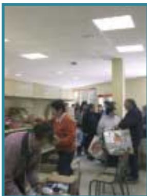
La banque alimentaire

Nous avons constitué un groupe de travail dans lequel l'ensemble des institutions et organismes sociaux étaient représentés : CCAS, Conseil Général, CHRS et bien sûr les associations humanitaires coutançaises. Ce groupe de travail s'est réuni régulièrement. Nous avons appris à nous connaître et avons travaillé sur les problématiques que chacun rencontrait. Nous avons eu une véritable réflexion collective. Très vite, nous avons défini des objectifs communs, auxquels la maison de la solidarité se devait de répondre.