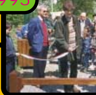
Inauguration du "Chemin du serpent" réhabilité à l'initiative du CDJ.

Etre membre du conseil des jeunes est une expérience unique et enrichissante, c'est une étape à la citoyenneté. Etre enfant est pour la plupart d'entre nous, le sentiment de ne pas être écouté : le conseil des jeunes est l'illustration de ce contraire. De l'idée d'un projet à sa réalisation, la parole des enfants est entendue. (Soazicq)