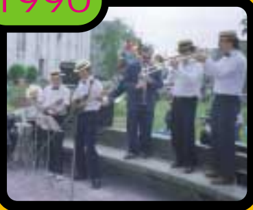
Inauguration en musique, de l'aire de jeux "du pommier" réhabilité à l'initiative du CDJ.