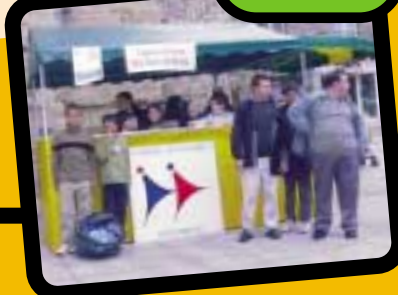
"Opération bouchons" au profit des personnes handicapées pour l'achat d'un fauteuil roulant.