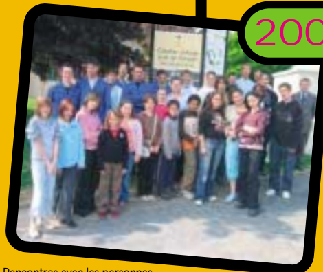
Rencontres avec les personnes handicapées du CAT de Condé sur Vire.