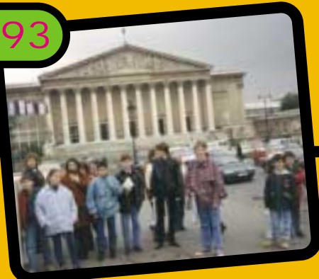
Rencontre avec le député Alain Cousin et visite de l'Assemblée nationale.