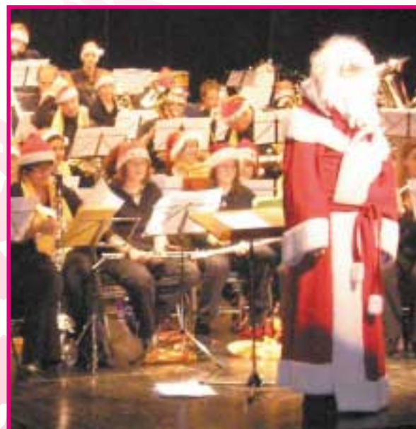
L'harmonie municipale aux couleurs de Noël

Spectacle de feu - 18h - place du parvis