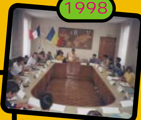
Échanges dans la salle du Conseil municipal avec le CDJ roumain de Campina.