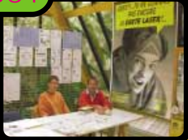
Participation à la "Journée des Associations" pour la promotion de la Carte LASER