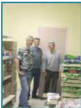
L'équipe de bénévoles