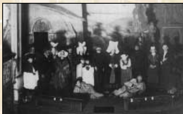
L'Ensorcelée, 1921, au théâtre.