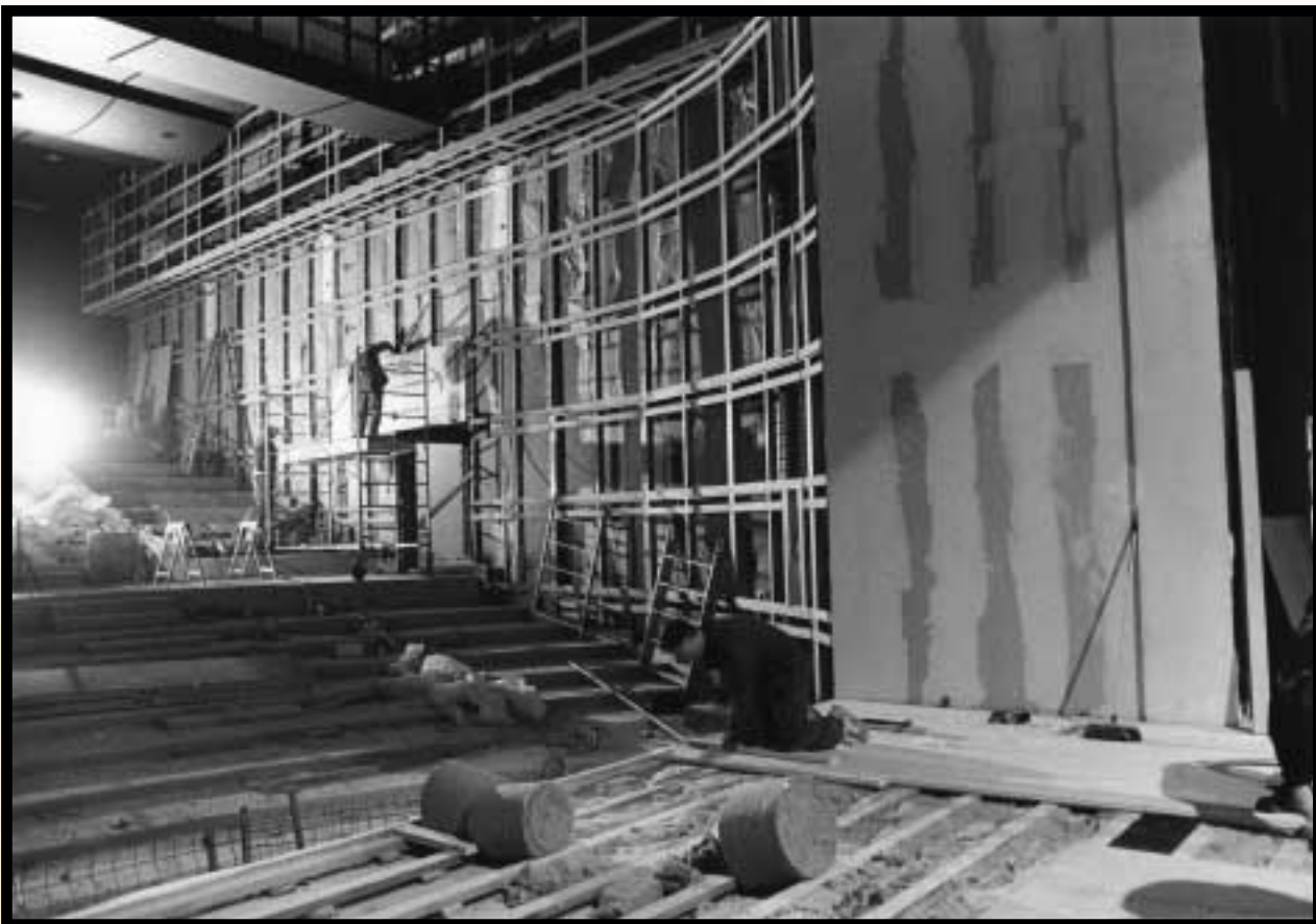
Rénovation du théâtre en 1998-1999

Le théâtre municipal est un des équipements qui fait la fierté de Coutances. Il est l'héritier d'une sorte de saga à épisodes itinérants dans la ville, sans unité ni de temps ni de lieu, avec ses rebondissements, ses pauses et un dénouement assuré peut-être par quelque deus ex machina...