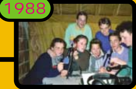
"Cool Raoul", l'émission du CDJ. L'équipe radio dans son studio d'enregistrement.

Au delà de cette expérience (très marquante !), j'ai l'impression d'avoir commencé à apprendre au Conseil à confronter et à échanger des idées pour construire quelque chose ensemble, à convaincre et aussi à écouter les autres, bref à travailler en groupe. Quand on est au primaire, et plus encore au collège et au lycée, une expérience comme celle-là est forcément un peu nouvelle, parfois déroutante, mais extrêmement formatrice. Aujourd'hui où tout le monde parle de "démocratie participative", je pense que cette expérience m'a aidé après coup à mieux comprendre l'intérêt de ce type de participation à la vie collective, et ses difficultés.