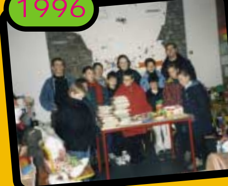
Collecte de jouets de Noël pour les enfants.