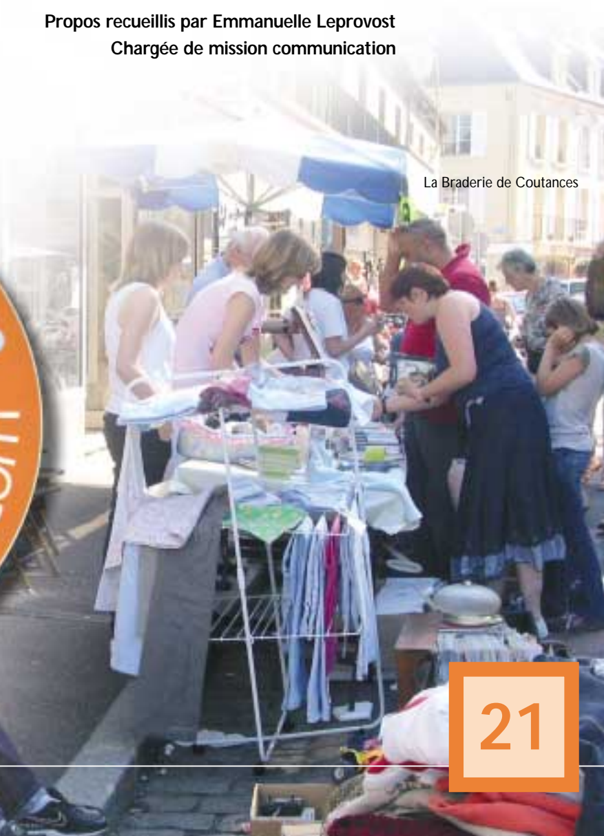
La Braderie de Coutances