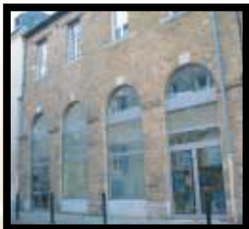
Façade subsistante de l'ancien théâtre, rue Clemenceau.