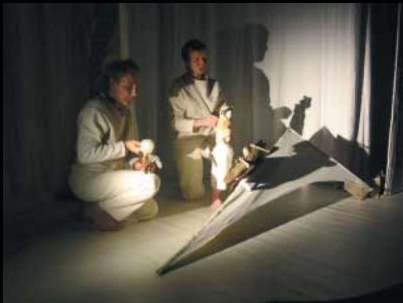
"Ninioq" spectacle mis en scène par la compagnie "Par les villages" installée à Savigny.

Bernard Fresson