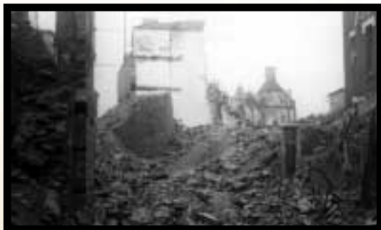
Rue Clemenceau après les bombardements.