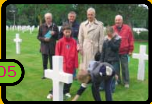
Fleurissement des tombes au cimetière américain de Colleville-sur-Mer dans le cadre de l'association "Fleurs de la Mémoire".