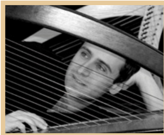
La harpe celtique figure parmi les nouveautés de la rentrée.

Outre les 60 créneaux d'activités déjà programmés, le centre d'animation propose huit nouveaux ateliers pour la saison 2011/2012 : atelier de blues, atelier d'espagnol conversation, atelier de technique de peinture sur verre et sur porcelaine, atelier d'arabe littéraire, atelier de cuisine ayurvédique, atelier de danse de salon et atelier de harpe celtique. Fort de son classement en nationale 4, l'atelier échecs va s'attacher les services d'un entraîneur afin de former les futurs compétiteurs de demain.