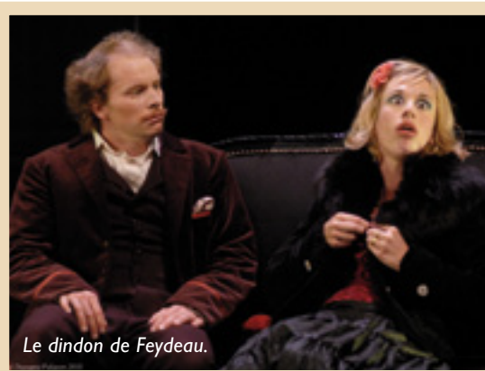
Le dindon de Feydeau.

... Et plein d'autres choses encore à découvrir le mardi 6 septembre à 20 h pour la traditionnelle soirée de présentation ou dans la plaquette du TMC. Ouverture des abonnements le mercredi 7 septembre, et la billetterie le samedi 17 septembre, à l'accueil des Unelles.