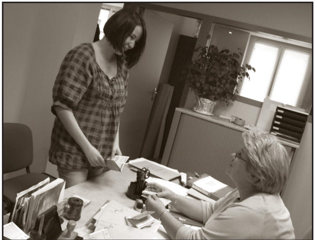
Une jeune coutanaise venant chercher son Pass Évasion

Pour tout renseignement, contacter l'Office de la Jeunesse au 02 33 76 55 77 et par courriel à jeunesse@ville-coutances.fr