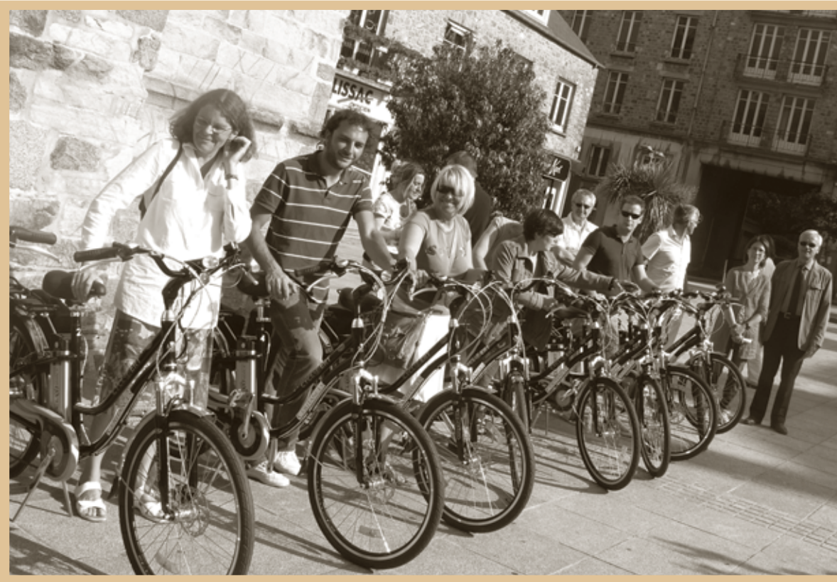
Les 10 premiers Coutançais ayant reçu leurs vélos électriques en location ! 28 juin 2010